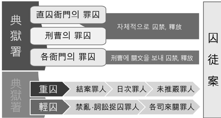
그림1-典獄署의 죄수 분류

하여 관리하였다. 25 이상을 바탕으로 전옥서에 수금된 죄수를 정리하면 그림1과 같다.