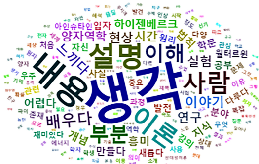
<그림 3> 빈도 기반 워드클라우드