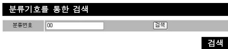
<그림 1> 아라비아숫자 형태의 분류기호에 의한 검색접근 환경

그런데, 도서관이 구축한 대부분의 데이터베이스가 분류기호를 기록할 수 있는 데이터필드 이외에 분류기호에 대한 학문맥락의 주제 분야를 기록할 수 있는 데이터필드를 갖추지 않은 채 구축·운영되어 왔다. 이로 인하여, 대부분의 분류검색 환경이 <그림 1>에서 보는 바와 같이 아라비아 숫자 형태의 분류기호를 통해 접근할 수밖에 없었다.