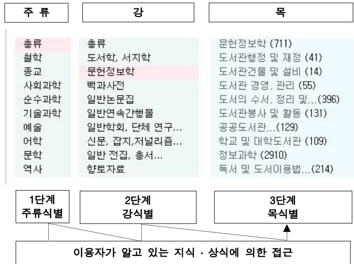
〈그림 2〉 분류 디렉터리에 의한 검색 환경