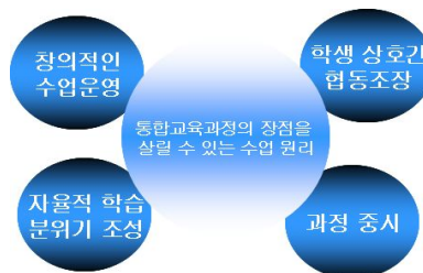
〈그림 2〉 협동수업의 원리

교과교사와 사서교사간의 협동수업이 학생의 창의력과 자주적 학습능력 등을 길러줄 수 있는 통합교육과정의 장점을 살리기 위한 수업원리는 학습과정 중시, 자율적인 학습분위기 조성, 학생 상호간 협동 조장, 창의적인 수업운영 등이다