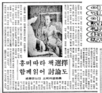
<그림 4> “여름방학 어린이 讀書指導”(『中央日報』, 1967.7.27)