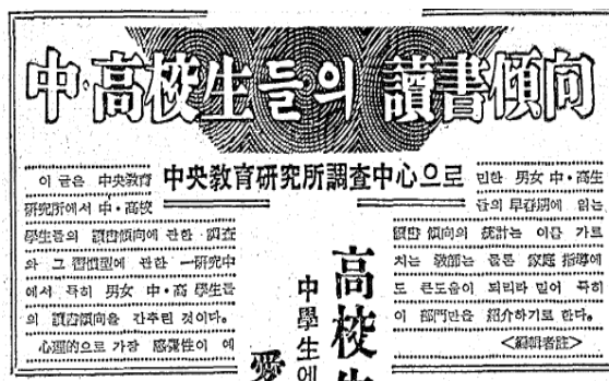
<그림 6> “中·高校生들의 讀書傾向”(『朝鮮日報』, 1962.7.10)

지금까지 살펴 보았듯이 신문 지면에는 주로 어린이 독서 관련 기사가 대부분이다. 그러나 종종 중고생들의 독서 경향을 게재하기도 했다. 이 중 1960년대 중고생의 독서 경향을 제시하는 기사로는 “中·高校生들의 讀書傾向”(『朝鮮日報』, 1962.7.10)이 주목된다. 이 글은 ‘중앙교육연구소(中央教育研究所)’가 조사한 중고교생의 독서 경향이다. 설문지를 통한 조사 결과로서 다음과 내용을 볼 수 있다.