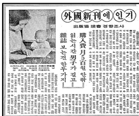
〈그림 2〉 “外國新刊에 인기”(『中央日報』, 1969.1.18)

우리나라 일반 독서층의 취향을 보면 일반도서(잡지류 포함)는 연평균 16권 이상을 읽는 자가 제일 많았으며 남자는 대체로 국내 문학서를, 여자는 외국 문학서를 더 선호하였다. 도서 구입비도 대체로 남녀 월 500원을 소비하는 층이 압도적이지만 여자의 경우 월600~1,000원의 도서비를 들 이는 층이 남자에 비해 더 많았다.(남자28%, 여자40%). 잡지는 남자의 경우 20~30세에서 월 3,