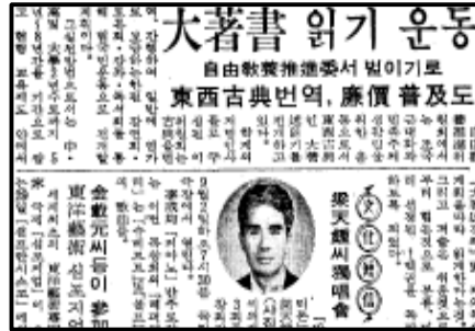
〈그림 10〉 “大著書 읽기 운동”(『中央日報』, 1966.8.23)

출판계에서도 독서 유도를 위한 다양한 활동들을 전개하였다. ‘대한출판문화협회’에서는 국민 독서 운동의 일환으로 국민교부, 중교교부, 대학부, 일반부로 나누어 독서 감상문을 모집하여 시상하기도 했고, 41) ‘생활독서위원회’와 ‘배영사’에서는 ‘문고관 생활독서’라는 이름을 내걸고 문고관 “생활독서심포지엄” 5권을 내놓았다. 전 30권 한질로 된 이 문고는 “국민이 틈틈이 책을 읽는 습관을 붙이는데 조금이라도 도움”을 주려는 목적에서 출판되었다 42)