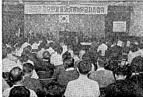
〈그림 9〉 新聞會館에서 “마을文庫” 2만 돌파 기념식과 유공자 시상식(『中央日報』, 1968.3.14)