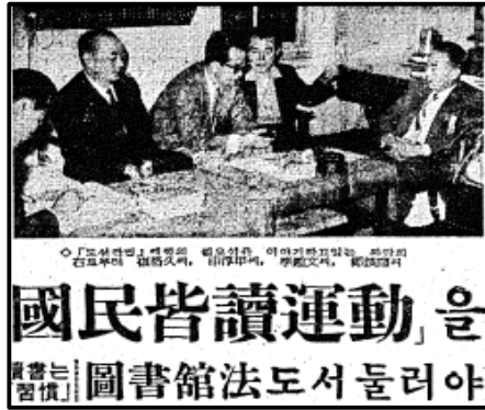
〈그림 8〉 독서주간을 맞이하여 펼치는 국민개독운동(『朝鮮日報』, 1963.9.27)

특히 1960년대는 전후 혼돈기를 지나 경제개발 5개년 계획이 추진되고 문화적인 차원에서도, 교육적인 차원에서도 도서관 운동이 활발하게 일었고, 전대에 비하여 도서관, 장서수 등이 급증한 때이기도 하다. 22)