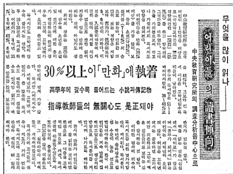
〈그림 3〉 만화에 집착하는 어린이 독서 경향을 비판하는 『朝鮮日報』의 “어린이들의 讀書傾向”(1966.7.19)

이 시기 아동 독서와 관련되어 가장 문제시된 것은 만화에 경도된 아동들의 독서 실태였다. “惡書出版이 판을 치고”(『中央日報』, 1960.10.20), “어린이들의 讀書傾向”(『朝鮮日報』, 1966.7.19), “어린이를 위한 책을 쓰자”(『中央日報』, 1966.1.13) 등을 그 예로 들 수 있는데, 장정도 천박한 만화, 폭력적인 내용의 만화에 빠져 있는 아동들의 독서 경향을 비판하고 있는 기사들이다.