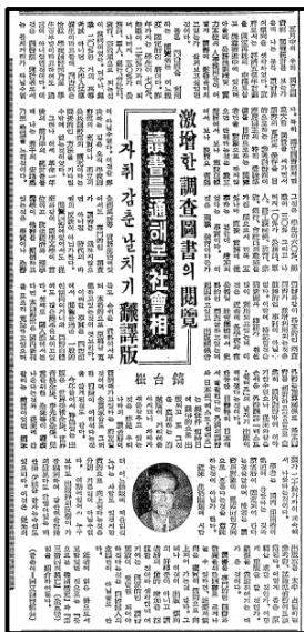
<그림 1> “讀書를 통해 본 社會相”(『朝鮮日報』, 1962.6.15)

인용문을 보면 당시 전년도(61년)까지 도서관 열람자는 학생과 무직자(대개 고등고시나 입시 준비생)가 95%로서 대부분을 차지하고 있다. 그 이유는 도서관의 열람실화 즉 “學生 공부방”으로 도서관을 이용하는 데에 있었다. “圖書蒐集과 保存을 目的”으로 하는 ‘참고도서관’이 좌석 위주, 특히 수험 준비를 목적으로 하는 열람자로 대부분 채워졌던 것이다. 그러나 1962년도에 들어서면 실무 종사자인 열람자 수가 증가 추세를 보이는데, 필자는 그 이유로 “現場 教育이라든가 企劃業務等 實務生活에 있어서도 專門的인 調査가 讀書를 通하지 않으면 아니되며, 時代에 있어서도 전문적인 지식을 위한 독서가 필요한 것의 反映 3) ”이라고 지적했다.