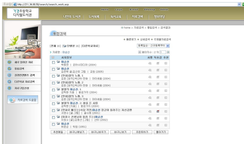
〈그림 2〉 Digital Library System의 간략형 서지화면