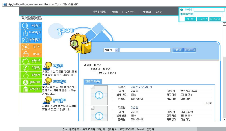
〈그림 4〉 Digital Library Solution의 간략형 서지화면