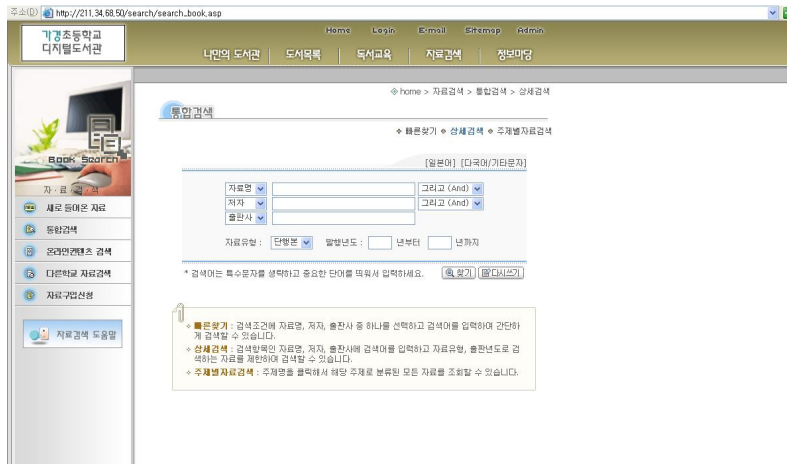
〈그림 1〉 Digital Library System의 상세검색화면

간략서지에서 서명을 클릭하면 해당 자료의 상세서지를 볼 수 있다. 또한 “자료검색 도움말”이 제공되지만 도움말의 내용이러든가 전개방식에 있어서 어린이 이용자들에게 실효성이 있을 것인가는 의문의 여지가 있다.