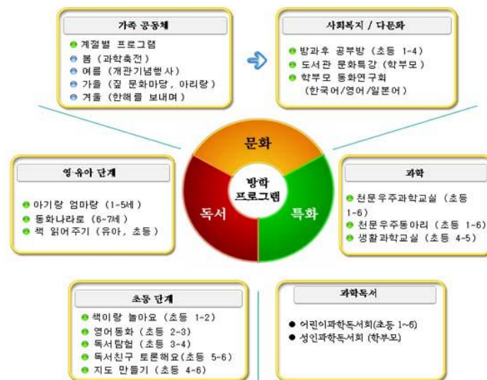
〈그림 2〉 청주기적의 도서관 학기중 평생학습 프로그램

청주기적의 도서관의 평생학습프로그램으로는 학기 중의 연령별, 주제별 독서 프로그램과 방학의 심화 및 주제 특화 과정이 있다. 가족공동체 프로그램으로 계절별 프로그램을 진행하고 있으며 사회복지 및 다문화적인 측면에서 방과후 공부방, 학부모를 대상으로 한 도서관 문화특강, 한국어, 영어, 일본어별로 학부모 동화연구회를 운영하고 있다. 영·유아단계에서는 아기랑 엄마랑, 동화나라로, 책 읽어주기를 진행하고 있으며, 초등단계에서는 책이랑 놀아요, 독서탐험, 독서친구 토론해요, 지도 만들기를 운영하고 있다. 과학분야를 특화시켜서 천문우주과학교실, 천문우주동아리, 생활과학교실의 운영 및 어린이와 성인을 대상으로 한 과학독서회를 운영하고 있다. 강사의 경우에는 인근에 위치한 충북대학교천문대, WISE(교원대), 서원대 유아교육과, 충북대 과학기술진흥센터 등의 교수진과 청주교육대와 한국방송통신대 등의 평생교육실습생과 연계하여 도서관의 행사 프로그램에 참여시키고 있다(표 7 참조).