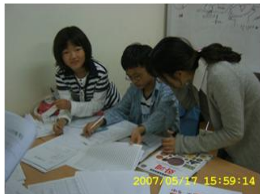
〈그림 4〉 지도 만들기 2