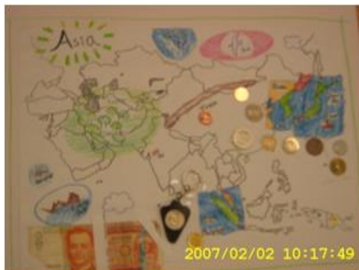
〈그림 3〉 지도 만들기 1