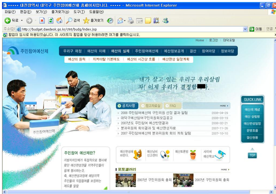
<그림 2> 대전광역시 대덕구 주민참여제도 홈페이지

공공도서관의 경우에도 적용할 수 있는 한 방법으로 홈페이지에 주민참여예산프로그램을 신설하고 예산의 계획, 집행, 결산을 공개하여 지역주민들이 각 과정별로 질의 및 의견 등을 제안할 수 있게 하여 예산집행에 관한 투명성을 담보할 수 있을 뿐 만 아니라 주민들이 공공도서관의 열악한 예산에 관심이 높아져 재정적 후원회를 조직하게 되는 계기를 마련할 수도 있다.