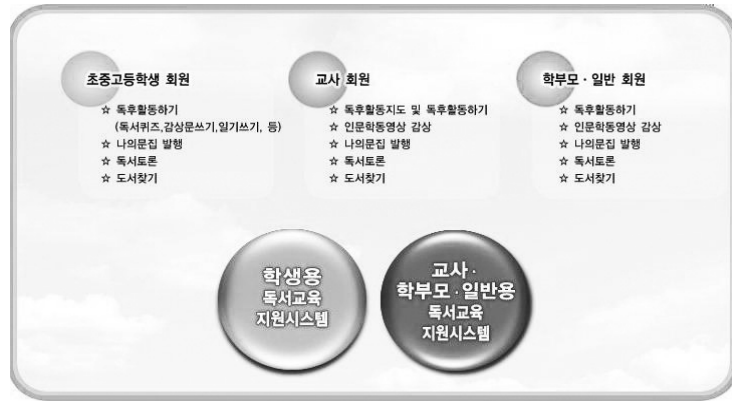
〈그림 2〉 부산교육청 독서교육지원시스템의 기본 구조