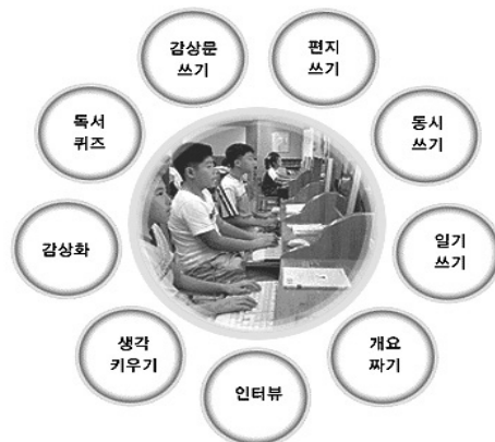
〈그림 4〉 부산교육청 독서교육지원시스템의 다양한 독후활동

다음으로 학생들의 독후활동의 종류를 살펴보면 아래의 〈그림 4〉에서 보는 바와 같이 감상문 쓰기, 편지 쓰기, 동시 쓰기, 일기 쓰기, 개요 짜기, 인터뷰, 생각 키우기, 감상화 그리기, 독서퀴즈 등의 다양한 활동이 가능하게 되어 있다.