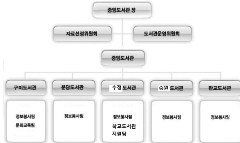
〈그림 3〉 본 연구에서 제안하는 성남시 공공도서관 조직도

둘째, 공공도서관 관리운영주체의 통합과 함께 조직체계의 변화가 요구된다고 하겠다. 본 연구자가 제안하는 조직체계 변화 방안과 조직도는 위의 〈그림 3〉과 같다. 즉, 중앙도서관장이 정보문화센터소장을 겸직하고 중앙도서관장이 총책임자가 되어 성남시 전체 공공도서관을 통합 관리·운영한다. 이렇게 되면 현재 5급 사서사무관으로 다른 분관과 동일한 직급인 도서관장의 직급을 4급으로 격상시키는 것이 가능하여 명실상부한 중앙도서관장의 위상을 갖게 될 것이다. 또한 사서출신 총 책임자(소장)를 중심으로 도서관을 관리·운영하는 것이 가능해 질 것이다.