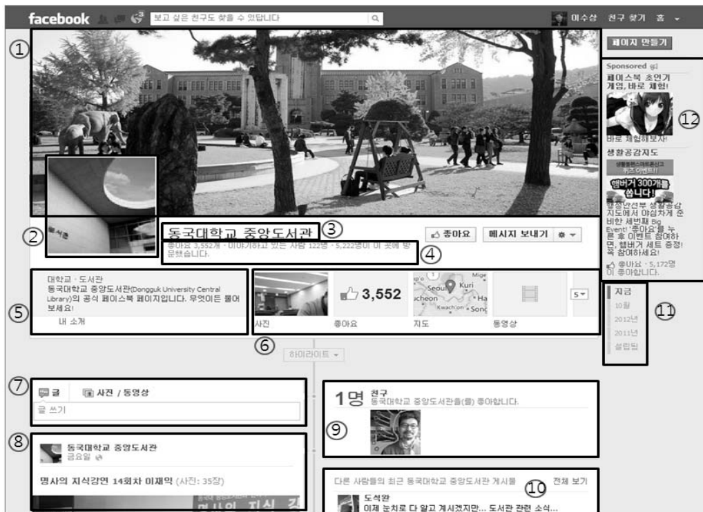
<그림 2> 동국대학교 도서관 페이스북 사례(31)

도서관 페이스북은 페이스북에서 도서관으로 들어가는 입구이다. 물리적 도서관의 입구, 도서관 포털이라는 웹 환경에서의 입구, 모바일 기기를 통한 입구 등 도서관의 입구는 여러 가지 유형이 존재한다. 도서관 페이스북도 이러한 유형의 하나가 된다. <그림 2>는 대학도서관 페이스북 페이지의 한 사례이다.