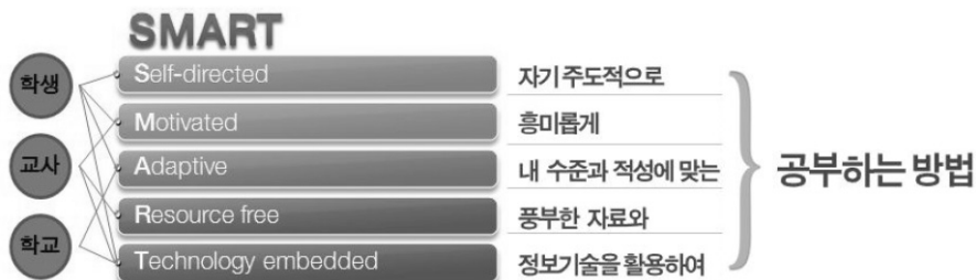
<그림 1> 스마트교육의 개념도 15)