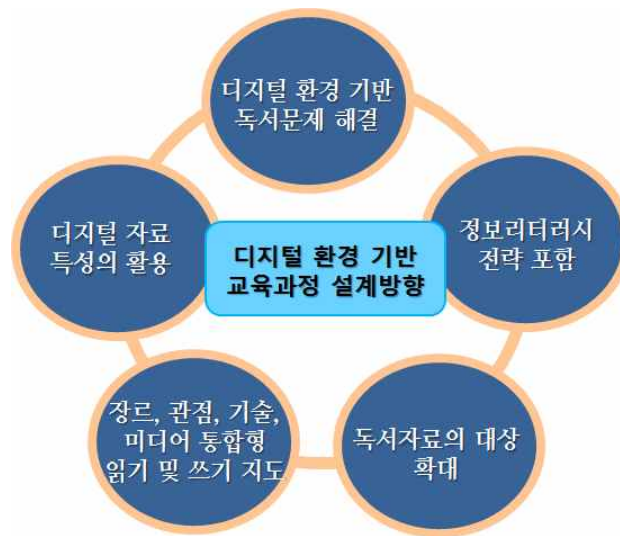
〈그림 3〉 디지털 환경 기반 독서지도 교육과정의 주요 설계방향

수 있는 전략이 포함되도록 설정하였다. 셋째, 멀티미디어, 하이퍼텍스트, 하이퍼미디어, 웹 등 다양한 독서자료를 독서의 대상으로 확대하여 독서지도의 지평을 확대하는 방향으로 구성하였다. 넷째, 그동안 독서지도 분야에서 이루어졌던 텍스트 위주의 읽기 및 쓰기 지도와 함께 다양한 장르, 관점, 미디어 및 통신기술을 통합하는 읽기 및 쓰기 지도가 독서지도 과정에서 동시에 이루어지도록 반영하였다. 다섯째, 디지털 자료의 특성인 ‘개인화 및 저작, 멀티미디어, 상호작용, 연계 기능’이 독서 행위에서 제대로 활용될 수 있도록 독서지도 과정에 포함되도록 구성하였다.