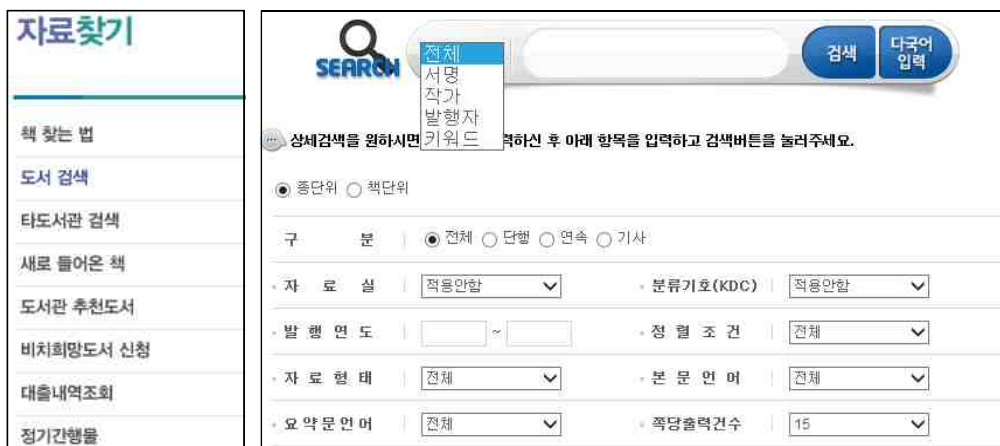
〈그림 1〉 A어린이도서관의 <도서 검색>

소설’을 검색하였다. <그림 2>와 같이 ‘292건’의 자료가 검색되었는데, 이들 자료는 모두 표제나 총서명에 ‘추리소설’이라는 단어가 포함된 자료들이다. 9) 현재 국내에서 제공되는 도서관 OPAC에서 주제 검색이 지원되지 않고 있기 때문에 <그림 2>의 검색결과에는 ‘추리소설’이 분명함에도 불구하고 표제나 총서명 등에 ‘추리소설’이라는 단어가 포함되어 있지 않은 자료는 모두 누락되어 있다. 이러한 상황을 이해할 리 만무한 어린이들은 그저 “너무 많은 자료가 검색되어 무엇을 선택해야 할지 모르겠다”거나 “검색어를 입력했는데도 자료가 검색되지 않는다”는 불평을 털어놓는다.