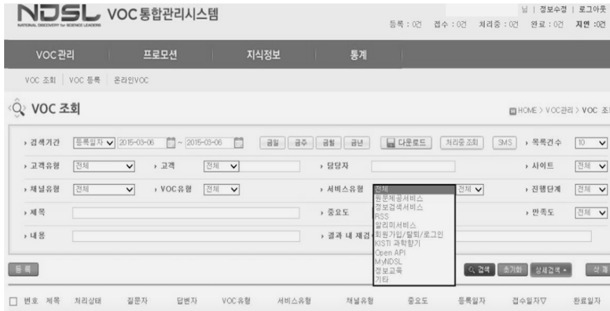
<그림 3> VOC 관리시스템(VCMS) 화면

마지막 소분류는 정보서비스의 요구나 문의 등의 질의내용을 범주화하고 계층적으로 세분화하여 유사한 질의별로 파악한 것이다. 내용 분석은 고객센터 근무경력이 3년 이상인 담당자 2명과 저자 3인이 수행하였다. 1,738건의 고객의 소리 제목, 내용을 상세히 살펴보고 빈번하게 발생하는 용어의 맥락적 의미를 검토한 후 VOC통합관리시스템에서 제공하는 대분류와 중분류에 VOC 내용이 적합하게 기재되었는지 교차 검토하여 분석하였다. 이들 내용분석을 요약하면 <표 4>와 같다.