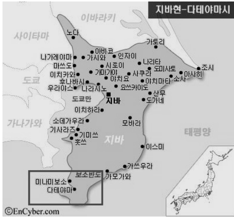
<그림 2> 지바현의 다테야마