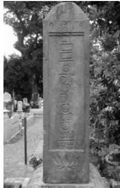
<그림 4> 한글로 쓰여진 나무아미타불(동면)