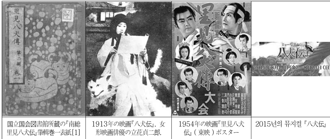
〈그림 10〉 다양한 문화컨텐츠로 재생산되는 『八犬傳』

현재 다테야마 성터는 공원으로서 시민들의 휴식처가 되고 있다. 이나무라 성터와 오카모토 성터는 국가 사적으로 지정되어 있다. 과거에는 「南総里見八犬伝」이 NHK의 인형극으로 방송된 적도 있어서 널리 알려져 있지만, 그 무대가 전국영주 사토미 가문이 170년에 걸쳐 통치한(NPO法人 南房総文化財・戦跡保存活用 フォーラム, “『南総里見八犬伝』と房総里見氏”, 리플릿) 아와국(현재의 남 소보, 아와 지역)인 것은 대다수 시민들이 알지 못하고 있었다.