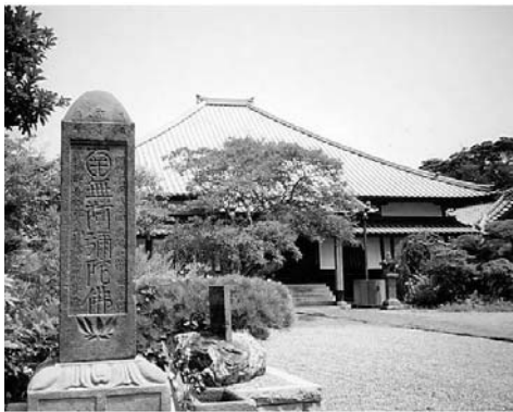
<그림 3> 다이간인과 사면석탑 전경

『지바현문화재[千葉縣文化財]』에서는 지바현 지정 유형문화재 <사면명호석탑(四面名號石塔, 이하 사면석탑)>에 대해 “1624년에 오요레간[雄譽靈巖] 큰 스님이 건립했던 현무암으로 만들어진 사각 기둥 모양의 명호석탑으로 총 높이는 219cm 이다. 석탑의 네 면, 즉 동서남북의 각 면에는 북(北)면의 인도 범자(梵字 : 산스크리트어), 서(西)면에 중국의 전자(篆字), 동(東)면에 조선의 한글, 남(南)면에 일본의 화풍(和風) 한자로, 일본에 불교를 전래해 준 각 나라의 말로 『南無阿彌陀佛』과 명호가 새겨져 있다. 이는 阿彌陀如來의 구제의 자비로운 빛이 널리 세상을 비추고 있음을 나타내고 있다. … (이하 생략)”라고 기록되어 있다(愛澤伸雄 2006, 55-58).