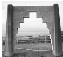
〈그림 8〉 아오키 시게루 서거 50주년 기념비