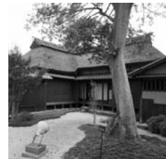
〈그림 9〉 아오키 시게루가 목었던 고타니 [小谷]씨의 집 전경

아오키의 「바다의 선물」이 1967년에는 근대 서양화로서는 처음으로 일본에서 중요문화재로 지정되었다. 일본 서양화계의 여명기를 장식하는 작품으로서, 많은 후진에게 영향을 주었고, 「바다의 선물」이 그려진 6년 후인 1910년에는 같은 메라에서 나카무라 쓰네가 <해변의 마을(하얀 벽의 집)>을 그렸다.