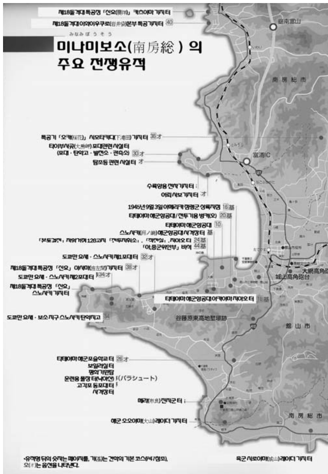
<그림 11> 미나미보소의 주요 전쟁유적

이었다. 그리하여 당시 육군은 도쿄만 연안에 많은 포대를 쌓게 된다. 이렇게 도쿄만 요새가 완성되어, 포대의 네트워크가 성립되었고, 다테야마 시내에는 스노사키 제1포대(1932년 완성), 스노사키 제2포대(1927년 완성), 북쪽의 미나미보소시[南房総市] 도미우라초[富浦町]에 다이부사미사키[大房岬] 포대(1932년 완성)가 설치되었다(NPO法人 安房文化遺産フォーラム 2012, 3).