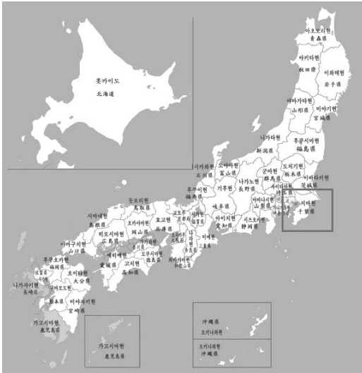
〈그림 1〉 일본의 다테야마

시대와 상황에 따라 바뀌는 것이라면 지역의 아이덴티티를 긍정적인 것, 사람이 살기 좋은 곳, 이곳에 살고 있다는 것 자체로도 자량이 되도록 만드는 것이 지역을 발전시키는 새로운 동력이 될 수 있을 것이다.