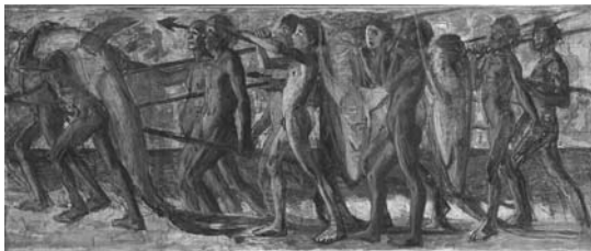
〈그림 7〉아오키 시게루의 그림 <바다의 선물(海の幸)>

다테야마시 지정문화재인 고타니씨 주택은 어업으로 번영한 메라에 남아있는 메이지 중기의 상류층 어부의 집이다. 그 구조는 분동(分棟)형 민가의 계통을 잇고 있으며, 지붕은 기와 지붕, 일부를 오오카베(기둥 양쪽에 판자를 붙이거나 회칠을 해서 기둥이 외부로 드러나지 않게 한 벽) 구조로 한 방화 구조로서, 전통적인 방 배치를 벗어난 근대적 방 배치의 경향을 나타내고 있는 점이 특징이다. 또한 메이지 시기의 서양화가 아오키가 임시로 거처하며 「바다의 선물[海の幸]」(중요문화재)을 제작한 가옥으로서도 널리 알려져 있다. 이렇듯 고타니씨 주택은 역사적 가치가 높고, 동시에 지방적 특색을 두드러지게 나타내는 다테야마 시내의 역사적 건조물로서 중요하다.