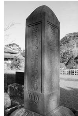
<그림 5> 전서(篆書)체 한자로 쓰여진 南無阿彌陀佛

한국에서도 지극히 희귀한 초기 한글 자형 3) 이 조각된 석조물이 왜 지바현 보소[房總] 반도 남단의 다테야마[館山]의 땅에 있는 것인가? 이 석탑은 16·17세기의 아와[安房]와 동아시아, 그중에서도 특히 조선과의 사이에 있어서 문화교류가 있었던 증거가 아닐까? 이처럼 석탑의 한 면에 한글로 새겨진 “나무아미타불”에 기반하여 문헌을 조사하고 연구하여 다테야마를 오래 전부터 한국과 우정을 나눈 <평화의 도시>라는 로컬리티를 재구성하고 있었다.