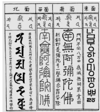
<그림 6> 4개 문자로 새겨진 나무아미타불