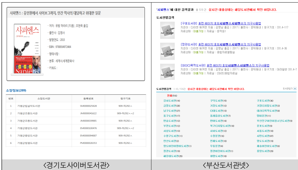
<그림 5> 지역 도서관 종합목록의 소장정보 제공 방식

성한 서지데이터 및 소장데이터를 중앙시스템에서 임의로 수집하거나 저장하고 있지는 않다. 부산도서관넷은 검색에 필요한 최소한의 데이터를 先수집하여 활용한다는 점에서 경기도사이버도서관과 유사하다고 볼 수 있으나, 경기도사이버도서관에서는 1개의 서지자료 및 이를 소장한 기관의 리스트와 관련 소장정보를 제공해 주는 반면, 부산도서관넷에서는 해당 자료를 소장한 기관들의 서지자료를 병렬로 나열해 주는 방식이라는 점에서 차이가 있다. 이렇듯 부산도서관넷의 종합목록은 하나의 서지정보에 복수의 소장기관에 대한 정보를 통합하여 제공하는 KOLIS-NET 및 경기도사이버도서관과 다른 방식이라 할 수 있다.