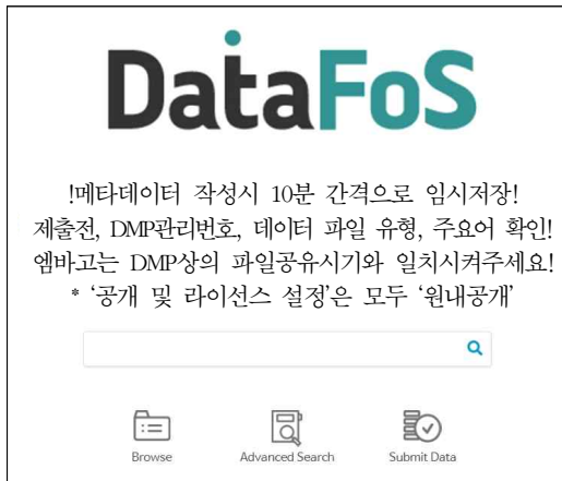
<그림 3> 국립산림과학원의 리포지토리

다음의 <그림 3>과 <그림 4>는 국립산림과학원의 리포지토리의 메인 화면과 해당 리포지토리의 컬렉션 구성 화면을 나타낸 것이다.