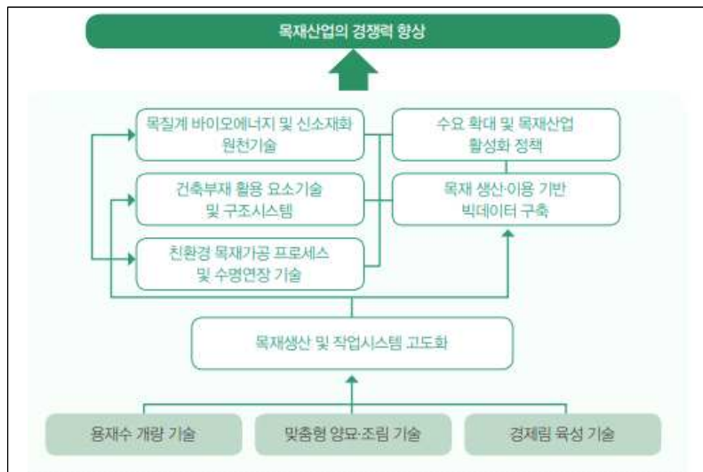
<그림 2> 목재이용연구부의 연구추진 체계도(국립산림과학원 2018)