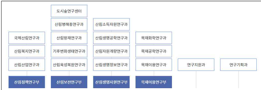
<그림 1> 국립산림과학원의 조직도(국립산림과학원 2020)

국립산림과학원은 산림과학기술의 개발과 보급이라는 고유 미션을 갖고, 산림자원의 보전 및 육성, 임산업 활성화, 산림재해 예방 및 관리 등 산림분야 R&D를 수행하는 국가연구기관이다. 그 중 목재이용연구부는 「최적 가공기술을 활용한 목재 이용 증진」을 목표로 “첨단 가공기술을 활용한 목재의 부가가치 증진연구”를 수행하는 목재공학연구과, “도시목조화를 통한 친환경 목재 수요 확대 연구”를 수행하는 목재이용연구과, “목질계 바이오연료, 펄프·제재 및 신소재화 기술 개발”을 수행하는 목재화학연구과로 구분된다. 다음의 <그림 1>은 국립산림과학원의 조직도 일부를 나타낸 것이다.