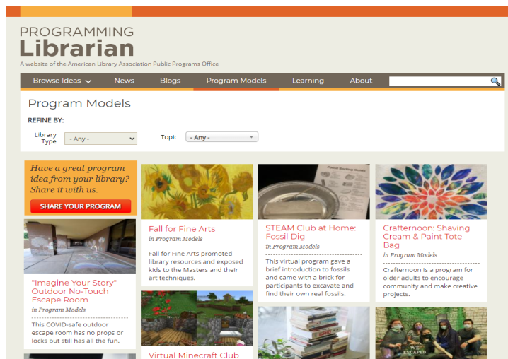
〈그림 2〉 Programing Librarian의 Program Models

사서들이 수행한 도서관문화프로그램은 'advance planning', 'marketing', 'budget', 'details day of event activity', 'program execution', 'advice' 등의 항목으로 상세하게 프로그램을 수행하는데 필요한 전 단계에 대한 설명을 기재하도록 되어 있다. 'advance planning'은 프로그램을 수행하기 전에 준비해야하는 사항이며 'marketing'은 홍보 방법, 'budget'은 소요 예산이나 예산에 대하여 논의할 사항, 외부협력 등에 대한 정보가 제공되고 있다. 'details day of event activity'는 프로그램 당일 진행과정을 설명한 것이고 'program execution'은 실제 도서관에서 프로그램을 하면서 발생한 과정과 상황을 기재한 것이다. 마지막으로 'advice'은 프로그램을 진행하고 나서 감상이나 주의할 사항, 다음에 고려할 사항들을 기재한 것이다. 프로그램 모델을 기술하기 위해 적용된 요소는 이 연구에서 미국공공도서관의 문화프로그램을 조사하는 기본 체계로 활용하였다. 'details day of event activity'는 프로그램의 형식을 분석하는 요소로 활용하였고 'marketing'은 마케팅 방식을 분석하는 요소로 적용하였다. 'budget'은 예산을 조사하는 항목으로 활용하였고 'advance planning'에 기술된 프로그램 대상자는 프로그램 대상자의 연령을 분석하는 요소로 적용하였다. 또한 'advance planning'과 'program execution'에서 설명한 프로그램의 내용은 내용 유형을 조사하는 것에 반영하였고 'program execution'에서 기술된 실제 프로그램에 참여한 이용자 수는 프로그램 규모 조사에 적용하였다.