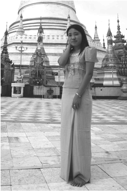
<그림 1> 개량된 여성의 복장