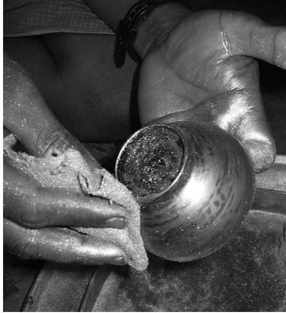
<그림 7> 칠기 표면에 은분을 칠하는 모습

그런 후에 문양을 새기고 건조시킨 후, 표면을 숯이나 사포로 가볍게 문지르면 갈색과 은색이 뒤섞이면서 저빵옹에서만 볼 수 있는 특유의 대리석 문양이 형성된다. 이러한 대리석 문양은 기존의 전통 칠기에 서 전혀 찾아볼 수 없었던 것으로 이 기법이 도입되었던 초기에는 상당한 인기를 누렸다.