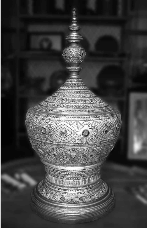
<그림 6> 전형적인 형태의 승옥

미얀마의 전통적 제작 기법으로 만들어진 칠기는 내구성이 요구되는 기물의 제작에 적합하였고 견고성도 매우 뛰어나 칠이 잘 벗겨지지도 않으면서 방수성, 방부성도 탁월하다는 점 때문에 이를 기초로 칠기 제작문화가 형성되어 왔다. 그러나 이러한 전통 기법의 제작은 손이 많이 갈 뿐만 아니라 공정과정도 매우 길어 하나의 완성품을 만들어내는 데에는 많은 노동력과 시간을 필요로 했다. 더욱이 천연 안료의 가격 상승과 더불어 플라스틱과 같은 새로운 소재들이 등장함으로써 새로운 제작기법의 도입을 필요로 하기 시작했다.