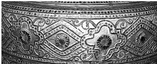
<그림 5> 호망지쉐차 기법이 적용된 따요 칠기의 표면

단순한 부조 형식을 벗어나 부조에 유리조각을 사용한 것도 보편적으로 제작되기 시작하였다. 위의 <그림 5>와 같이 특별히 유리조각을 붙여 넣는 기법을 ‘호망지쉐차’(hmanzishecha, 색채 유리 조각)라 한다. 유리조각은 문양의 구도에 따라 생칠을 발라 붙인다. 호망지쉐차는 주로 일반 불교도가 승려나 파고다에 공양을 올리는데 사용하는 종교 의례용 칠기 제작에 주로 사용하는 기법으로 대표적인 기물이 바로 아래 <그림 6>에서 보이는 ‘승옥’(hsunouk)이다.