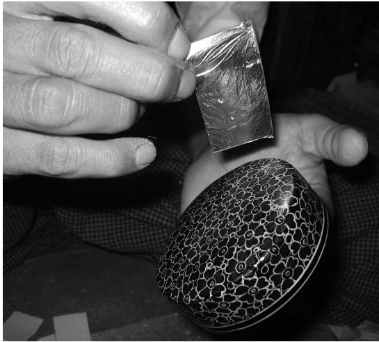
<그림 3> 금박을 칠면에 붙이는 모습

을 새긴 후 가장자리를 따라 황색 안료를 만든다. 그런 다음 음각된 문양에 생칠(生漆)을 바르고, <그림 3>과 같이 칠이 마르기 전에 금박이나 금분을 칠면 전체에 부착시켜 24시간동안 말린다.