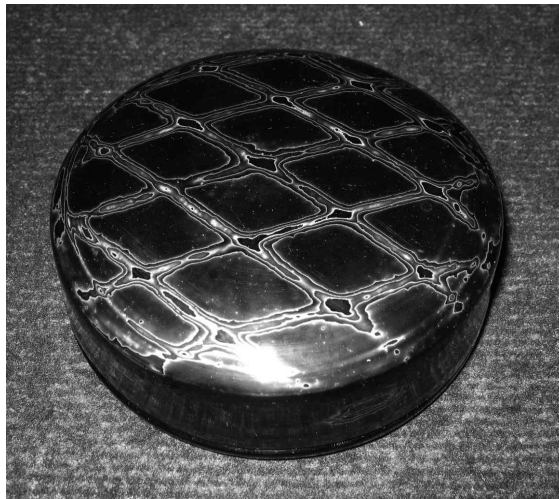
<그림 8> 독특한 대리석 문양의 저빵옹

그런 후에 문양을 새기고 건조시킨 후, 표면을 숯이나 사포로 가볍게 문지르면 갈색과 은색이 뒤섞이면서 저빵옹에서만 볼 수 있는 특유의 대리석 문양이 형성된다. 이러한 대리석 문양은 기존의 전통 칠기에 서 전혀 찾아볼 수 없었던 것으로 이 기법이 도입되었던 초기에는 상당한 인기를 누렸다.