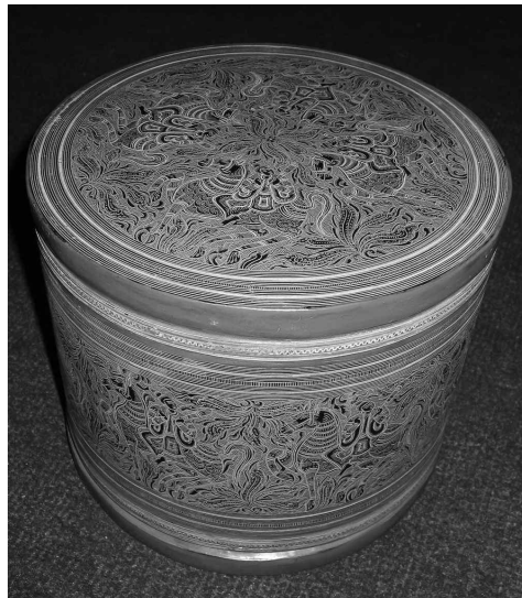
<그림 2> 일반적인 형태의 꽁잇

과거 미얀마인의 생활도구 대부분은 전통 칠기로 이루어져 있었다. 쟁반, 도시락, 기름 저장통, 르팻(차잎)을 담는 그릇 등 그 용도는 실로 다양했다. 그 중에서 가장 주목할 만한 생활 도구가 <그림 2>와 같은 빈랑(檳榔)열매상자로 미얀마어로는 ‘꽁잇’(kunit)이라 하는 상자이다. 미얀마에서 ‘꽁’(빈랑열매)을 씹는 관습은 매우 보편적이다. 꽁은 특별한 기념일이나 행사 등 사회 전반에 걸쳐 미얀마인들의 기호품이었고, 식민지 시대 이전에는 손님을 접대하는데 있어서 필수적으로 제공되었다.