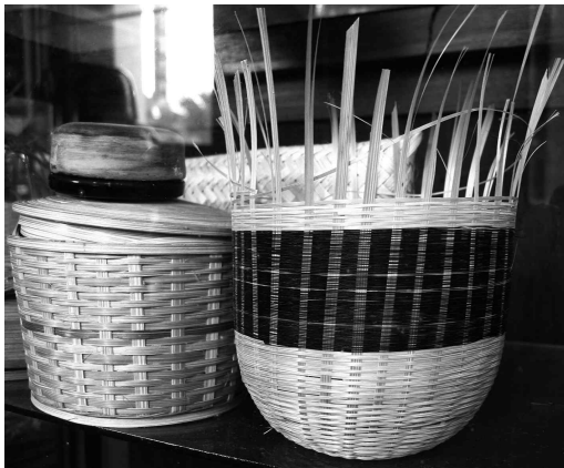
<그림 1> 말총을 엮어 만든 소지

용의 제작 과정은 우선 대나무를 얇게 저민 열편(裂片)을 사용해 기본 틀을 만드는 것으로 시작한다. 보통 열편은 둥글게 감아 만드는 기법을 사용하거나 지역에 따라 직물을 짜듯 엮어내는 기법을 병행해 사용하기도 한다. 이렇게 대나무 열편을 이용해 만든 칠기는 두께가 얇아 크기가 작은 기물을 만드는에 유용할 뿐만 아니라 무게도 가벼워 사용이 편리하다. 특별히 아래 <그림 1>과 같이 대나무와 말총을 엮어 낸 소지(素地)는 무게가 더욱 가볍고 신축성도 좋아 보통 최고급 칠기 제작에 사용된다.