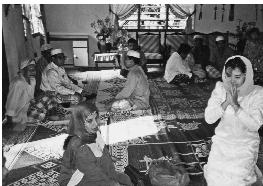
<그림 1> 혼례에서 신부가 이슬람 교리에 따라 혼인서약을 하고 있는 장면

혼인서약은 이맘에 의해 집행된다. 이맘은 혼례에서 혼인서약을 주관하는 공식적인 역할뿐 아니라 혼례의 시작과 끝을 알리는 역할을 수행한다. 그는 혼례의 전반적인 사항을 관장하는 실질적이며 상징적인 존재이다. 혼례에서 이맘의 실질적 역할을 혼례를 이슬람식으로 주관하는 것이다. 이는 혼인서약의 핵심을 이룬다. 말레이시아의 말레이 사회에는 이슬람 교구(kariah)가 있는데, 여기서 보통 1명의 이맘을 임명하여 소관업무를 주관한다. 이맘은 이슬람 사원의 금요 대예배 뿐 아니라 교구 내에서 발생하는 모든 종교 관련 업무를 수행한다. 이런 점에서 각 교구에 속한 이맘은 마치 1인 정부와도 같은 역할을 한다고 할 수 있다. 혼례에서 신부가 소속된 교구의 이맘은 혼인서약은 물론 혼인신고와 등록 등을 포함하여 혼인과 관련된 모든 책임을 지는 존재이기도 하다.