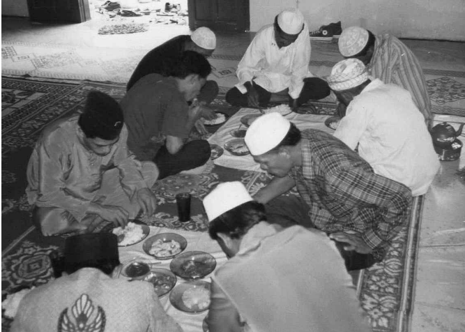
<그림 3> 하객들이 함께 식사를 나누는 끈두리의 모습

식사를 마친 하객들이 모두 집으로 돌아가면 신랑은 신부 집에 남아 일주일을 지내는 것이 관례로 되어 있다. 그런 다음 신랑과 신부는 신랑 집을 방문한다. 신랑 측 가족들은 신랑과 신부를 환영하는 끈두리를 개최한다. 신랑의 집에서 열리는 이 끈두리는 ‘사위나 며느리를 맞이하는 것을 기념하는 끈두리’(kenduri untuk hantar menantu)라고 불린다. 여기에는 신랑과 신부 친척들과 신랑 측의 가까운 이웃들이 참석한다. 이 자리에서는 초대를 받은 사람들이 서로 인사를 나누고 신부를 신랑 측 친척들에게 선보이는 행사가 마련된다. 서로 인사를 마친 손님들은 함께 식사를 마친 후 신랑과 신부를 신랑 측 집에 남겨둔 채 자기 집으로 돌아간다. 이것으로 혼례의 모든 과정이 끝난다.