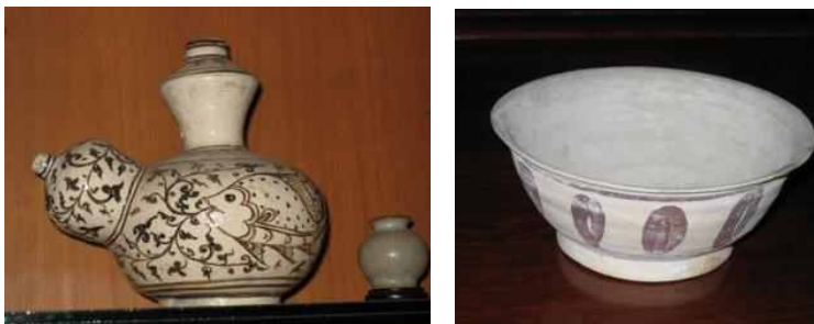
<그림 6> 위양까롱출토 도자기

위양까롱 지역은 도자기를 만들기에 가장 적합한 지역으로 평가받고 있다. 그 가장 큰 이유가 이 지역의 태토에 있다. 태국 전역에서 이 지역에서만 생산되는 고품토와 흡사한 질을 가진 백토로 점성과 입자가 좋아 가볍고 단단한 재질을 자랑한다. 또한 1300도의 고온에서도 잘 견디어서 그 순도가 아주 높은 아름다운 색감의 도자기를 만들 수 있었다. 이 지역에서 출토된 도자기를 열루미네스스 연대측정법으로 추정해 보면 약 13세기부터 제조를 했던 것으로 보인다. 위양까롱의 도자기는 대체로 다음과 같은 과정을 거쳐 만들어진 것으로 보인다.