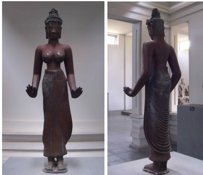
<그림 8, 8-1> 락슈민드라 로케슈바라입상. 9세기말-10세기초. 베트남 짱남성 당빈현 동주옹 출토. 청동. 높이114cm. 다낭시 참파박물관.

다음으로 락슈민드라 로케슈바라입상이라 불리는 작품<그림 8, 8-1>도 매우 독특한 형태를 취하고 있다. 이 작품은 짱남성 당빈현의 동주옹에서 출토하였는데, 9세기말이나 10세기초의 참파의 동주옹 양식을 보여주는 작품이다. 머리카락을 위로 틀어 올려 장식한 두발