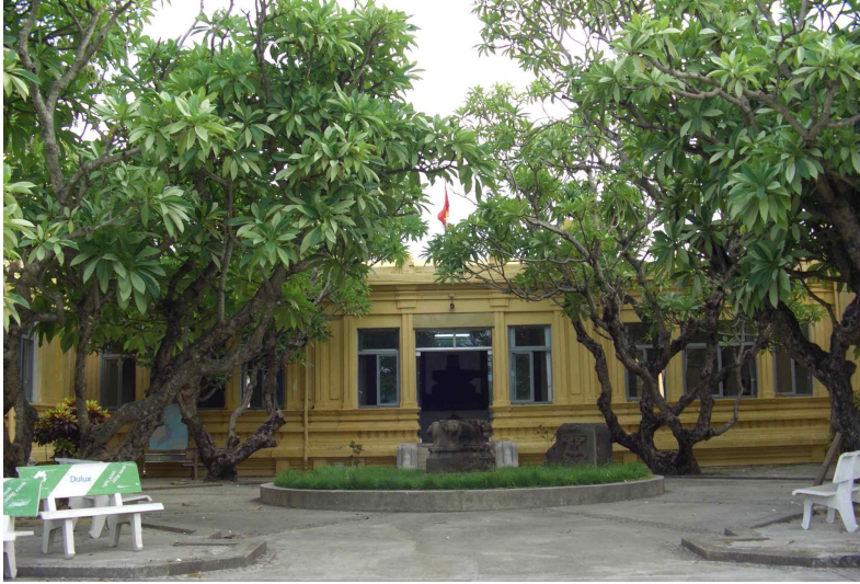
<그림 1> 다낭시 참파조각박물관 전경.

고, 불상도 몇 점 눈에 띈다. 이글에서는 몇몇 힌두교 존상을 중심으로 다낭시 참파조각박물관 소장유물에 대해 간략히 소개하고자 하며, 구체적인 논고는 향후의 과제로 삼고자 한다.