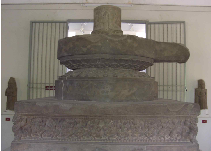
<그림 3> 링가제단. 10세기후반. 베트남 팡남성 즈이센현 차큐 출토. 사암. 높이190cm. 다낭시 참파조각박물관.

생각되는 사람 얼굴 모습의 기와도 나와 주목을 받기도 했다. 다만, 이 시기 이후의 상황에 대해서는 그다지 명확하지는 않지만, 6-7세기의 비교적 이른 시기의 작품도 출토되었고, 10세기후반까지의 전기차큐양식, 그리고 11세기전반부터의 후기차큐양식 등으로 추정되는 유물이 다수 발굴되었다. 출토유물의 대부분은 다낭시 참파조각 박물관에 소장되어 있다.