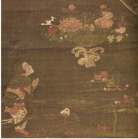
<그림 3-1> 일본 센소지 소장 수월관음도에 표현된 선재동자 세부표현.