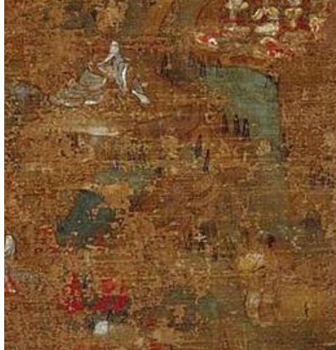
<그림 4-1> 도다이시 소장 華嚴五十五小繪의 10면 중에서 勝熱바라문을 찾아간 선재동자의 세부표현.