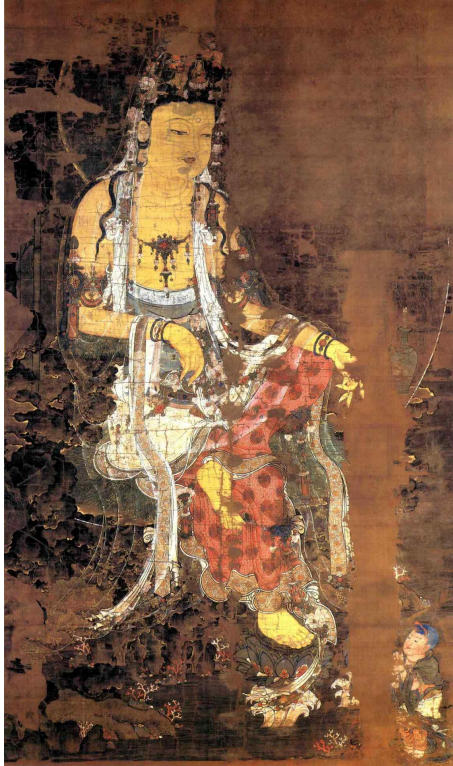
<그림 1> 수월관음도. 고려후기. 일본 가가미신사 소장.