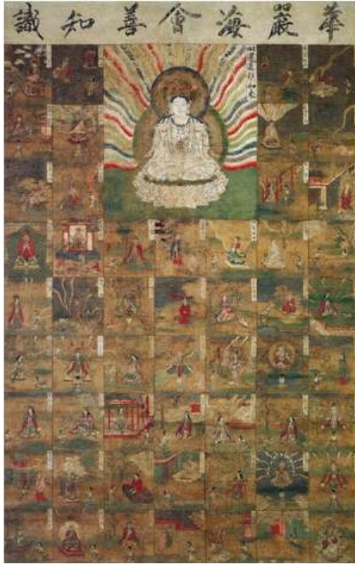
<그림 6> 華嚴海會善知識曼多羅. 비단에 색. 세로 182.4cm. 가로116.1cm. 가마쿠라시대(13세기). 도다이지 소장.