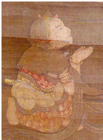
<그림 6> 서구방 필 수월관음도의 선재동자 세부표현. 고려시대. 1323년. 일본 센오쿠하쿠코칸 소장.

표현되고 있는데, 이는 선재동자의 산스크리트어가 Sudana로 ‘풍족한 베품’이란 뜻이며, 또 선재동자의 출생 시에 갖가지 귀한 보배가 저절로 솟아났다고 하는 선재동자와 관련된 이야기에 적합한 묘사라고 볼 수 있다. 두 발을 가지런히 모으고, 무릎을 약간 굽히고 서 있거나, 혹은 한쪽 무릎을 세우고 꿇어앉아 가슴 앞에서 양손을 다소곳이 모아 합장하면서 화면 상단의 관음보살을 바라보는 모습에서 구법을 찾고자 원하는 선재동자의 간절함이 절로 느껴진다.