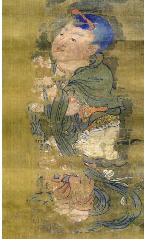
<그림 1-1> 일본 가가미신사 소장 수월관음도에 표현된 선재동자 세부표현.