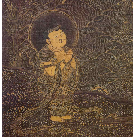
<그림 4> 일본 다이토쿠지 소장 수월관음도의 선재동자 세부표현.