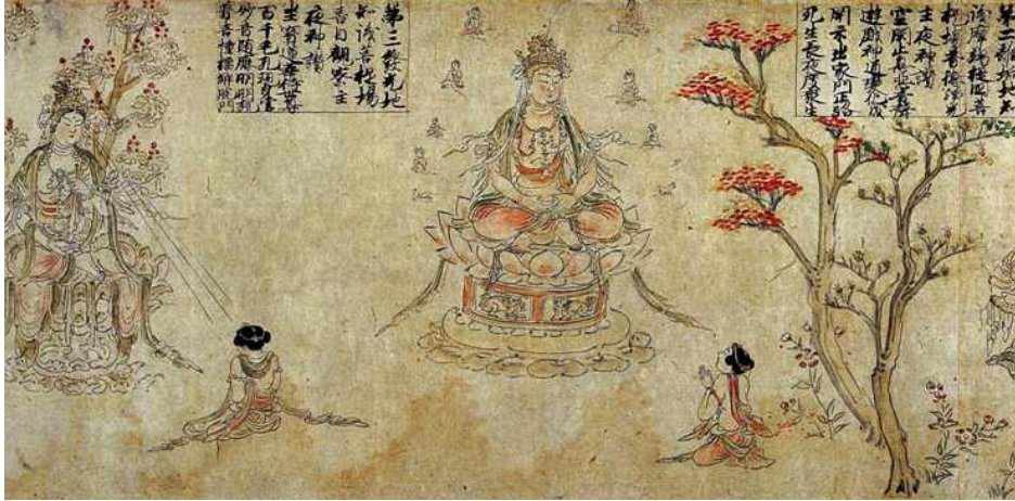
<그림 5> 『華嚴五十五所繪卷』중에서 普救衆生妙德主夜神(바라보아 왼쪽)과 喜目觀察衆生主夜神(바라보아 오른쪽)을 찾아가는 선재동자. 도다이지 소장.

천인이 2인, 野天이 8인, 동자가 3인, 동자의 스승이 1인, 海師가 1인, 장자가 10인, 의사가 1인, 여성이 10인, 외도가 1인, 왕이 2인이다.