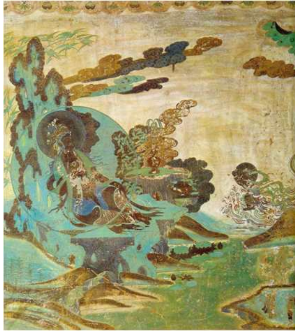
<그림 8> 수월관음도. 서하. 러시아 예르미타주박물관 소장.

앞아 있는 관음보살의 모습과, 멀리서 찾아온 선재동자의 모습을 볼 수 있다. 지금까지 보아온 구도, 즉 바라보아 우측에 관음보살이 배치하고, 왼쪽 하단부에 선재동자가 표현되는 구도와는 정반대로 되어 있고, 채색에서 느껴지는 푸른 백의 색채감 등은 한국과 일본과는 다른 모습을 보여주지만, 전체적인 면에서는 유사한 모습임을 알 수 있다.