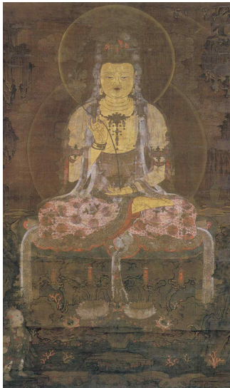
<그림 2> 수월관음도. 일본 고잔지 소장. 출처: 『고려불화대전』도 54 인용.

하고 시선은 선재동자를 향하지 않고 정면을 응시하는 모습을 취하거나, 혹은 센소지 소장의 작품처럼 비스듬히 서서 선재동자<그림 3, 3-1> 3) 를 바라보는 형식도 보인다.