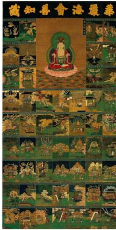
<그림 7> 華嚴海會善知識曼多羅. 비단에 색. 세로134.9cm. 가로80.6cm. 중국 명대(15세기). 일본 도다이지 소장.

중국에서 제작된 것이 판명된 작품이라고 한다. 이 두 작품은 상단에는 중앙에 노사나불과 그 좌우로 6개의 장면이, 그리고 하단에는 42개의 장면이 배치되어 있다. 한편 도다이지 개산당에서는 지금도 매년 4월 24일에 선지식공양 법회가 열린다고 한다. 개산당에 이 작품을 걸고, 법회의 서두에 55선지식을 권청하고, 끝부분에 55선지식의 이름을 부르면서 예배한다고 한다.