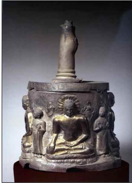
<그림 3> 은도금사리기, Pyu시기(5~6세기), 미얀마 Bago지역 Thayekhittaya의 Khimba 마운드 폐사원지 출토, Yangon 국립박물관 소장. 現高58.1cm.

라의 주요 도로로서 아마 서울의 종로거리와 같은 의미를 지니지 않았을까 생각된다. 이러한 의식에는 마치 우리나라의 영산재처럼 다양한 변과 그림들이 동원되었다. 아마도 불치사리가 도착했을 때 이를 이운한 메가반나왕을 재현한 것으로 보이는 왕의 복장을 한 사람이 읊었던 석가보살의 본생담, 즉, 시비왕 본생, 살타태자 본생 등이 그림의 소재로서 유행했던 것으로 보인다. 이는 스리랑카에서 자주 도해되었던 불교도상이 무엇이었는지 알려주는 귀중한 자료라고 하겠다. 이와 함께 법현이 다음에 언급하고 있다시피 오백신, 즉 대략 500여개의 본생담에 등장하는 내용이 실제 도해되었음을 알 수 있는데, 그 중에서도 수대나(須大拏) 변상, 즉, 수다나(Sudāna) 자타카, 그리고 섬(睽) 변상, 즉, 사마(Sāma) 자타카 및 코끼리 자타카, 사슴왕 자타카 등은 실제 법현이 본 변상도로서 스리랑카에서 인기를 끌었던 것으로 보인다. 또한 합창의 내용 중에 “붓다의 열반 후 1,497년”이라는 기록이 나오는데, 이것에 의하면 붓다의 열반은 기원전 10세기 이전의 일이 되어버린다. 이는 붓다의 입멸 시기를 추정하는데 있어 남전설이나 북전설에 모두 부합