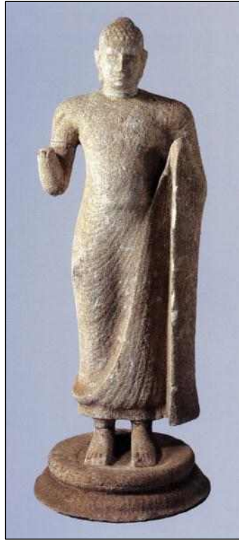
<그림 1> 석불입상. 후기 Anurādhapura 시기(7~8세기). 白雲石. 스리랑카 아누라다푸라 출토. 아누라다푸라 고고박물관. 高200cm. 출처: 『世界美術大全集』 東洋編12, 東南アジア의 삽도125 인용

살펴볼 불치사리 신앙이고, 그 다음은 위 기사에 보이는 불족적(佛足跡) 신앙이었던 것으로 보인다. 위에서 북쪽의 발자국은 지금의 아누라다푸라(Anurādhapura)이고 산꼭대기는 불족산(佛足山)으로서, 현재는 아담스 피크(Adams Peak)라고 불리고 있다. 불족적이 아담의 발자국이 된 것은 인도가 이슬람화 된 이후의 일이었다. 특히 이븐 바투타의 『여행기』를 보면 스리랑카를 방문하고 이를 아담의 족적으로 간주하고 있으며, 마르코 폴로의 경우는 이 족적이 아담의 족적으로 전해지고 있지만, 아마도 아닐 것이라고 추정하고 있어서, 중세 스리랑카 불족적의 다양한 시선을 읽을 수 있어 흥미롭다. 또한 불족산 맞은편으로 15유연(由延) 6) 떨어진 또 다른 불족적에는 탑을 세우고 사찰을 건립했는데, 이 사찰은 무외산사라 불렸다. 이 사원은 아바야기리 비하라(Abhayagiri-vihāra)를 말하는 것인데 뒤에 다시 언급하겠지만, 이 무외산사는 창건 당시 진보적 성격을 띤 교단이었다. 7) 이 사원에는 또한 앞서 언급한 바와 같이 스리랑카의 특산물로 추정되는 청옥으로 만든 불상도 봉안되어 있었으며, 아마도 불족적을 기념하는 성격을 지녔던 상으로 추정된다. 그 높이가 무려 12m 가량이나 되었다고 하므로, 매우 거대한 석상이었음을 알 수 있다. 아마도 청옥상으로 불상을 조각하고, 그 위에 칠보로 된 공양물을 걸어두었던 것으로 추정된다. 이 불상이 어떤 모습이었는지는 알 수 없지만, 스리랑카에서 발견되는