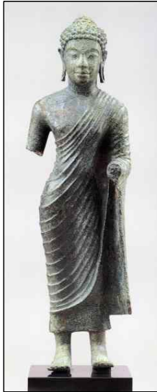
<그림 11> 청동불입상, 초기시대(7~8세기), 인도네시아 Kalimantan 출토, 뉴욕 메트로폴리탄 미술관, 高27cm.