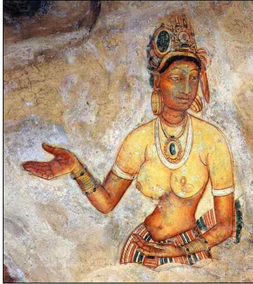
<그림 4> 여성공양자, Anuradhāpura시기 (5세기 후반~말엽), Sigiriya 암벽에 그려진 벽화.

하지 않는 연대로서 12) , 당시에 석존의 입멸 연대를 더 오래 전으로 올려 보는 관념이 있었음을 짐작할 수 있다.