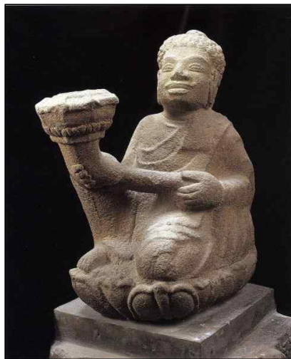
<그림 7> 승려좌상. Champa Dong Duong 양식(9세기말~10세기초), 베트남 Dong Duong 출토. 참파조각박물관. 사암, 高 54.9cm.

서, 의정의 설명에 의하면 스리랑카 사람들은 두벌의 캄발라를 입는데, 재봉질하지 않은 모직천으로 되어 있으며, 허리띠 대신 길이 4m 가량의 넓은 천으로 허리를 둘러 아래로 내려뜨린 복식을 착용했던 것으로 풀이이다. 대북 고궁박물관(臺北古宮博物院) 소장의 <唐閻立本王會圖>에 묘사된 사자국 사절<그림 7>의 모습과 일치하지는 않지만, 의정에 의하면 앞에서 여미는 옷이 아니라 뒤집어쓰는 형태의 옷인 듯하며, ‘두 심(兩尋)’ 길이의 허리에 두르는 길다란 천은 캄보디아 관음보살입상이 착용한 하의<그림 8>나 혹은 남경박물관(南京博物館) 소장 <양직공도(梁職貢圖)>에 나타난 낭아수(狼牙修) 35) 사절이 착용한 몸을 감고 있는