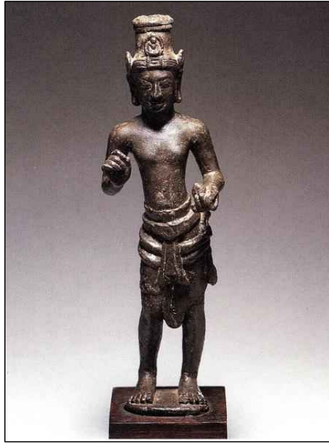
<그림 9> 관음보살입상, 프리앙코르 시기(7세기), 캄보디아 Takeo주 Angkor Borei, Wat Kompong Luong 출토, 프놈펜 국립박물관. 高17.8cm.

서, 의정의 설명에 의하면 스리랑카 사람들은 두벌의 캄발라를 입는데, 재봉질하지 않은 모직천으로 되어 있으며, 허리띠 대신 길이 4m 가량의 넓은 천으로 허리를 둘러 아래로 내려뜨린 복식을 착용했던 것으로 풀이이다. 대북 고궁박물관(臺北古宮博物院) 소장의 <唐閻立本王會圖>에 묘사된 사자국 사절<그림 7>의 모습과 일치하지는 않지만, 의정에 의하면 앞에서 여미는 옷이 아니라 뒤집어쓰는 형태의 옷인 듯하며, ‘두 심(兩尋)’ 길이의 허리에 두르는 길다란 천은 캄보디아 관음보살입상이 착용한 하의<그림 8>나 혹은 남경박물관(南京博物館) 소장 <양직공도(梁職貢圖)>에 나타난 낭아수(狼牙修) 35) 사절이 착용한 몸을 감고 있는