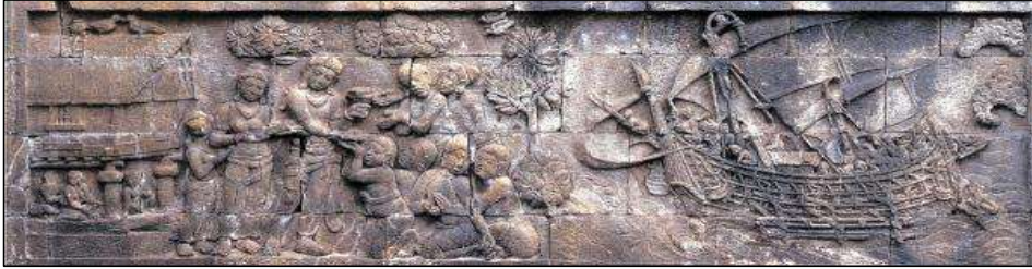
<그림 5> Rudrāyana Avadāna 중 바다건너 히루카(Hiruka)에 도착한 히루(Hiru), 중부자바기(8~9세기), 인도네시아 자바 Borobudur 사원 제1회랑 북랑 하단.

지부 계통도 있었음을 알 수 있다. 이외 아함계통과 잡장경류 18) 가 유통되고 있었음도 엿볼 수 있다.