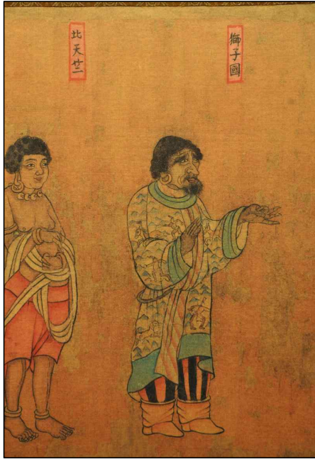
<그림 8> 臺北古宮博物院 소장 <唐閻立本王會圖>의 복제본(국립공주박물관 소장) 중 獅子國 사절 부분.