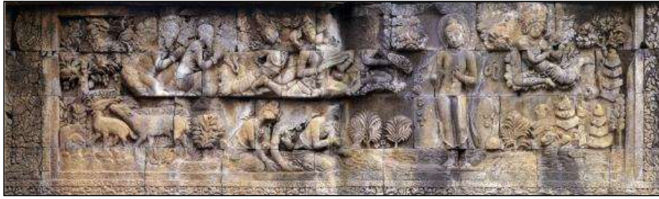
<그림 15> 『랄리타비스타라』 변상(니런선하에서 목욕하는 붓다), 중부자바기(8~9세기), 인도네시아 자바 Borobudur 사원 제1회랑 북랑 상단.

반에 드실 때까지의 일대 불법을 모두 모아 시로 만든 것인데, 오천축과 남해에서 이를 諷誦하지 않는 사람이 없다(의정 2004, 652). 42)