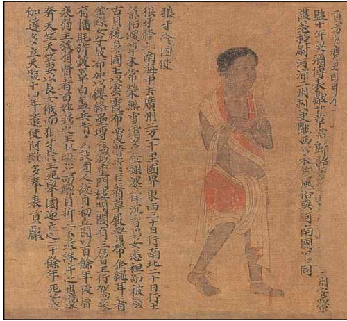
<그림 10> 南京博物館 소장 <梁職貢圖> 중 狼牙國 사절 부분.