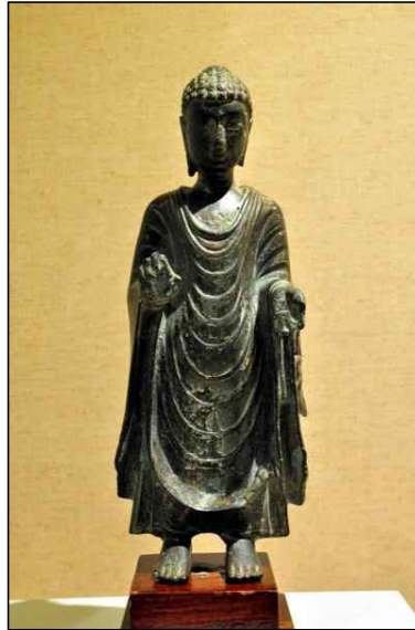
<그림 12> 불입상, 부남, 6세기, 청동28.3cm, 호치민시 베트남역사박물관. An Giang성 Thoai Son현 Oc Eo, Chua Linh Son 출토.

있으며 누울 때 비로소 판방에 있게 한다. 남해의 여러 섬의 법도 이와 같았다(의정 2004, 622). 37)