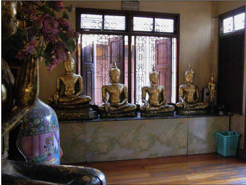
<그림 14> 왓 트라이미트(Wat Trimit) 법당 안의 작은 금동불상들 봉안사레. 태국, 방콕.

우선, 불상을 세욕시키는 것은 사시(巳時)에 한다고 하였는데, 사시는 오전 9~11시 사이이므로, 앞서 기사 B-6에서 기술하고 있는 바와 같이 “아침마다 세욕시킨다”는 것은 구체적으로 사시경이었음을 짐작할 수 있다. 또한 이 경우는 승방의 불상뿐만 아니라, 불전의 불상도 함께 언급하고 있는데, 불전의 불상을 밖으로 내어 세욕시키는 것이므로, 이것은 큰 불상이 아니라 이동이 가능한 작은 불상들이 법당 안에 많이 봉