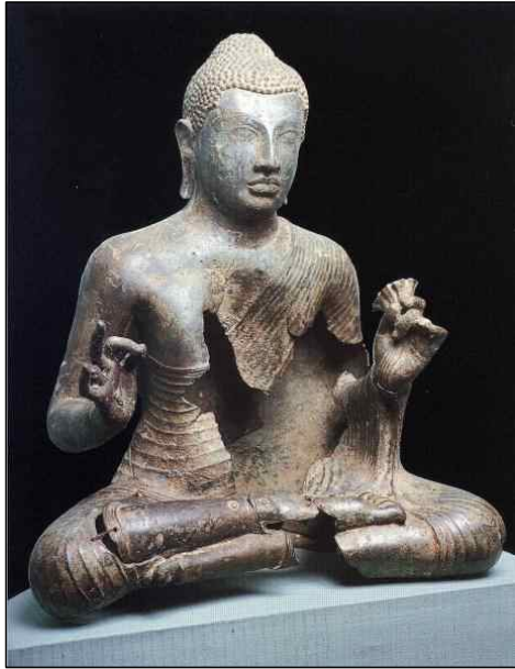
<그림 2> 불좌상, Anuradhāpura시기(5~6세기), 청동, 스리랑카 Badulla 출토, 콜롬보 국립박물관. 高54.5cm.