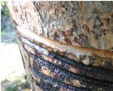
<그림 1> 옷나무 수액.

옷나무에 관한 식물학적 분류는 Carl Linnaeus (1707-1778)가 확립한 이후, 많은 논란을 거쳐 1937년에 Alexander Barkley (1817 - 1893)에 의해 옷나무의 형태학적 연구와 種의 기재로 정립된다. 옷나무의 식물학적 분류군은 被子植物門(학명 Angiosperm ), 雙子葉植物綱(학명 Dicotyledoneae ), 無患子目(학명 Sapindales ), 옷나무科(학명 Anacardiaceae )에 속한다.