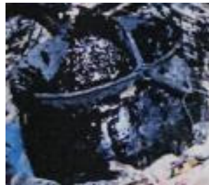
<그림 13>Burmese lacquer tree의 수액. (옷산 thitsiol)

또, 품질의 식별은 옷산의 종류의 상이성보다는 수액 속의 옷산의 함유량과 색, 냄새, 건조시간 등으로 판별한다. 옷나무 수액 속의 옷산 함유량은, 나무의 나이와 채취 방법에 의해 크게 영향을 받는데, 옷산은 오래된 나무보다는 어린나무에 많이 함유되어 있다. 특히 한국, 일본, 베트남의 채집방법은 옷의 채취가 끝난 나무는 베어버리는 殺搔法이기 때문에 옷산의 함유량의 차이는 적고, 중국, 미얀마의 경우는 채취가 끝