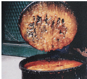
<그림 12>검양옷나무 변종의 수액. (옷산 Laccol)