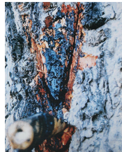
<그림 3> Burmese lacquer tree의 수액.