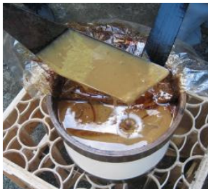
<그림 11> Rhus Verniciflua의 수액. (옷산 Urushiol)

일반적으로 옷의 품질은 식재된 토양과 기후의 영향 많이 받는다. 기후와의 관계성은 강수량이 적을수록 수분함량이 낮아 품질이 좋고 보존성도 좋기 때문에 비오는 날에는 채집하지 않는다. 반대로 건조한 기후는 수액 속의 점도가 높아지기 때문에 질이 좋지 않다. 따라서 동북아시아에서는 6-11월에 옷을 채집하며, 동남아시아의 옷 채집 시기는 지역에 따라 상이한데, 베트남의 경우 우기가 끝나고 기온이 떨어지기 전까지가 적기이며, 특히 8-10월이 가장 질이 좋은 옷이 채취된다. 미얀마는 여름이 가장 좋고, 우기는 그 다음이고, 건기는 가장 나쁘다.