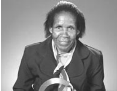
<그림 1> '골드만 환경상(The Goldman Environment Prize)' 수상시(2001)의 모습.

까(Timika)에 설립된 금, 은, 구리광산인 미국 프리포트(Freeport) 회사 소유 광산 폐기물로 인해 많은 주민들이 중금속에 중독되어 사망하고 가축들이 피해를 보고 물이 오염되는 상황에서 여성운동을 조직화하여 인도네시아 정부와 결탁한 글로벌 자본주의로 인한 불평등에 맞서 싸운 인물이다.