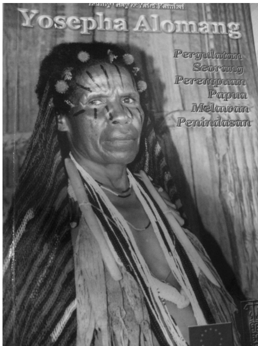
<그림 5> 『요세파 알로망(Yosepha Alomang)』책 표지.

1999년 12월, ‘Yap Thiam Hien’ 수상시에는 압두하르만 와히드 대통령 재임시에 수상한 것으로 대통령이 수상 초청장을 보냈지만 요세파는 자카르타로 가지않고 파푸아에서 받겠다고 했다. 파푸아의 모든 주민들이 보는 앞에서 받고 싶었던 것이다. 정부측은 요세파의 청을 수용하여 함께 초청받은 85명의 팀과 함께 자야뿌라로 가서 수상을 하였다. Goldman상은 2001년 4월 23일에 미국 샌프란시스코에서 수상하였다. 그는 수상소감에서 “30년이상 프리포트는 우리의 환경을 파괴하고 우리를 죽였습니다. 이 상과 함께 미국정부와 국민들에게 전하고 싶습니다. 프리포트가 저지른 많은 문제들에 대해 함께 책임을 져야 합니다”라고 강조했다. 모두의 진심어린 축복을 받고 고국으로 돌아왔다.